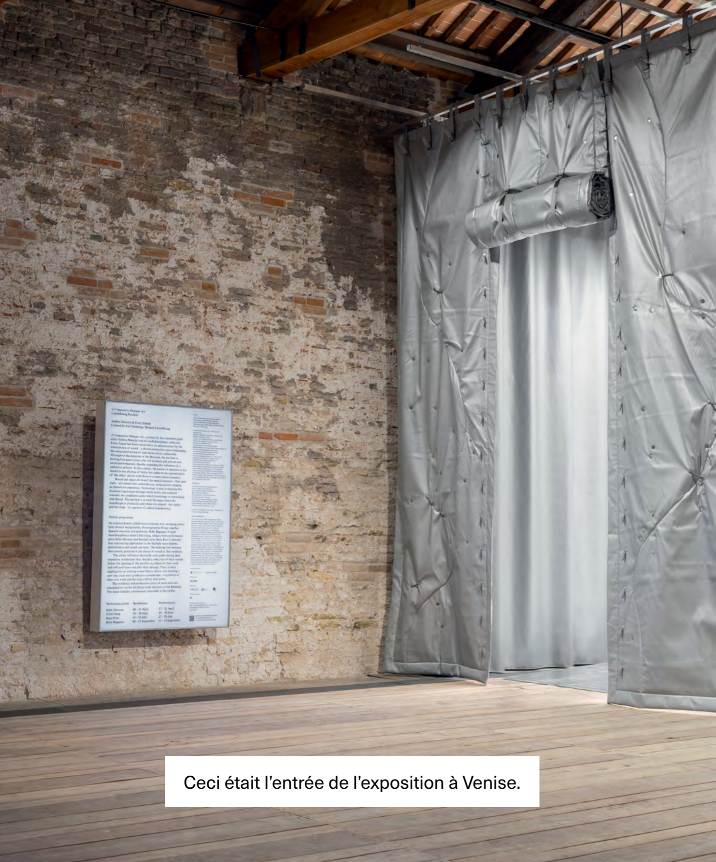
Ceci était l'entrée de l'exposition à Venise.