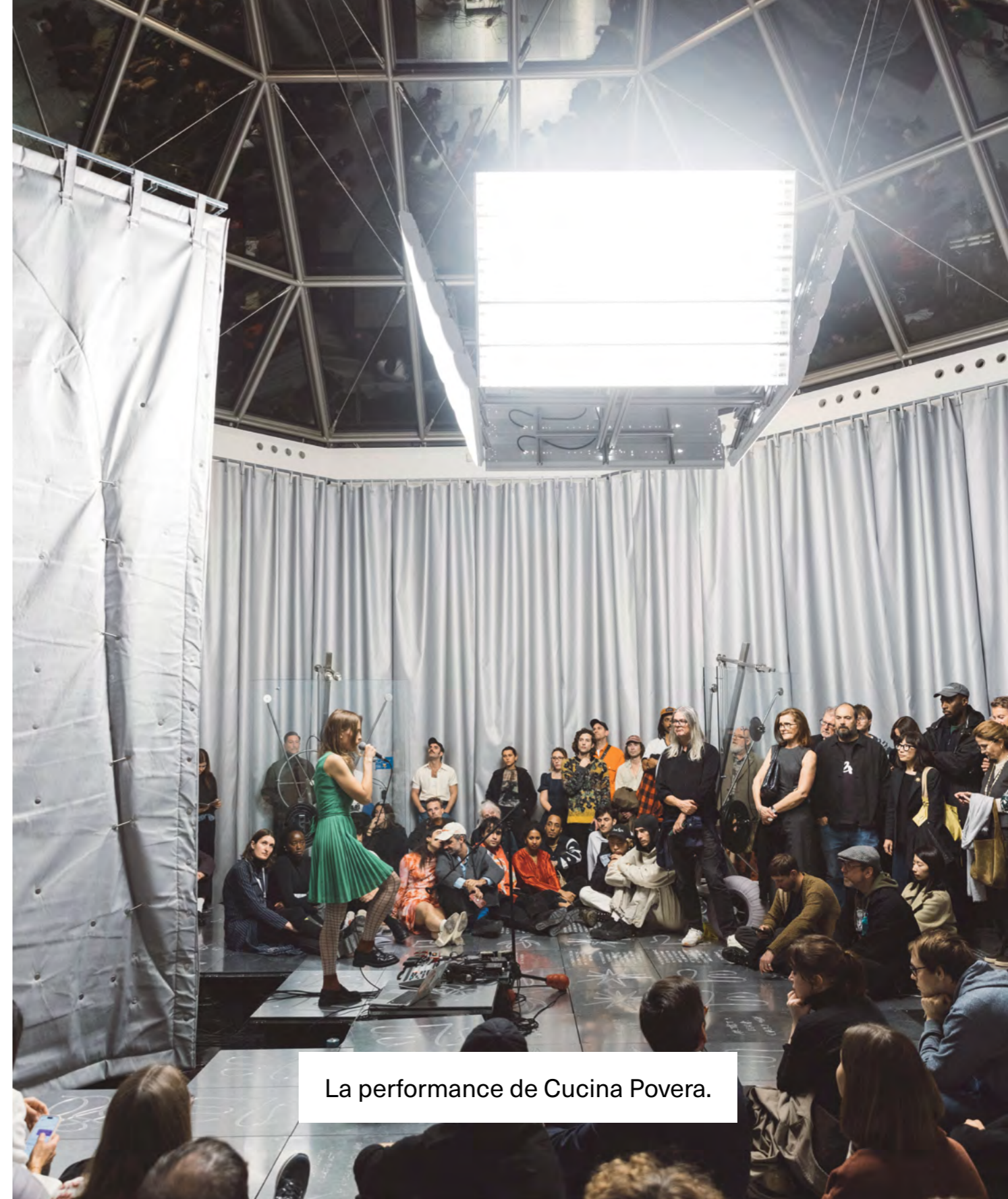
La performance de Cucina Povera.

Une performance peut avoir beaucoup de surprises !