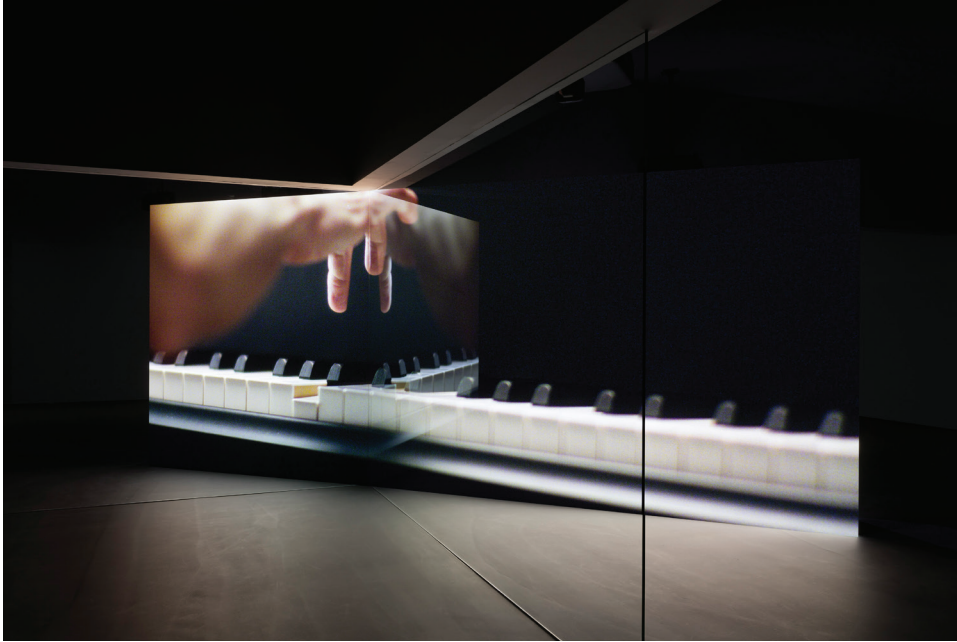
Anri Sala, Take Over , 2017 (film still)