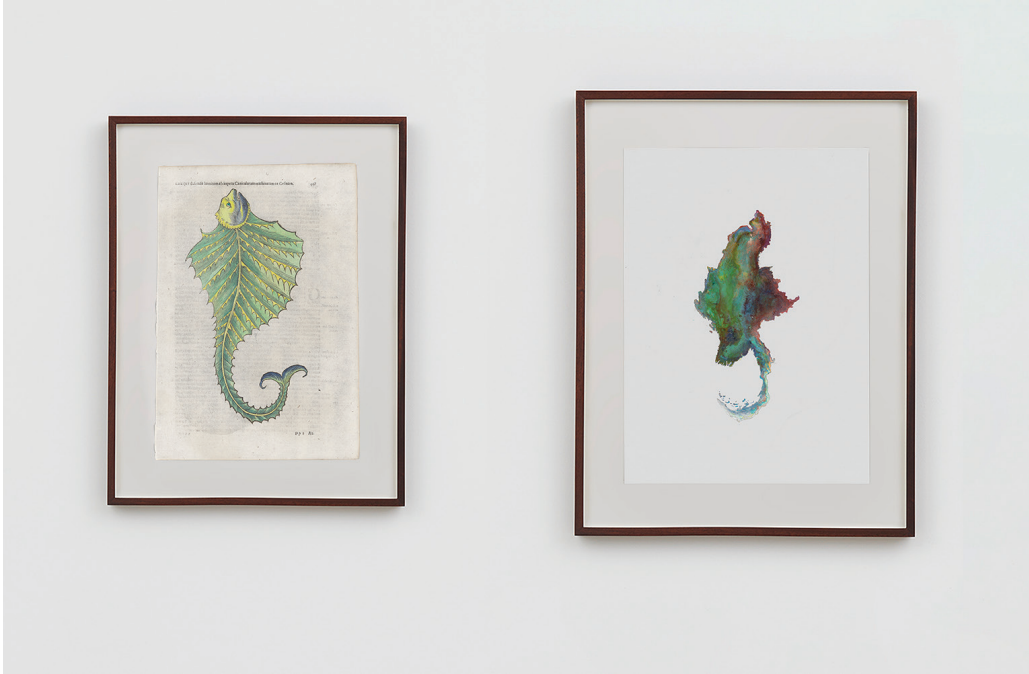
Anri Sala, Untitled (Giant Ray/Myanmar) , 2019