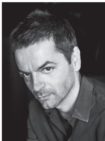
Anri Sala