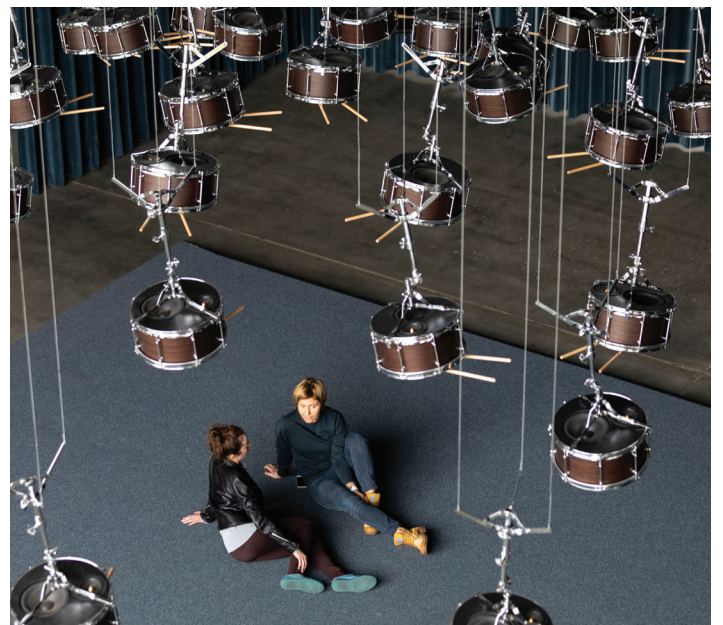
Anri Sala, The Last Resort , installation view, Garage Museum of Contemporary Art, Moscow, 2018