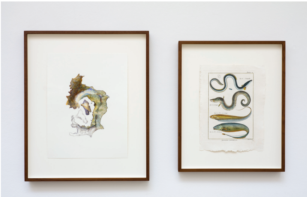
Anri Sala, Untitled (Italy/Anguille, Congre, Carape, Passan) , 2018 Courtesy the artist and Galerie Chantal Crousel, Paris Photo: Florian Kleinfenn © Anri Sala / ADAGP, Paris 2019