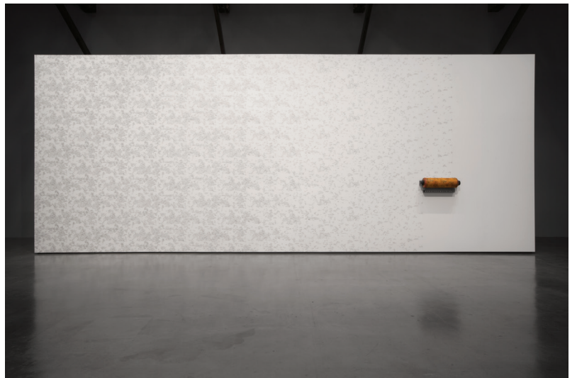
Anri Sala, All of a Tremble (Delusion/Devolution) , 2017