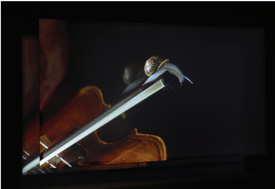
Anri Sala, If and Only If , 2018 (film still) Courtesy the artist, Marian Goodman Gallery and Galerie Chantal Crousel, Paris © Cathy Carver