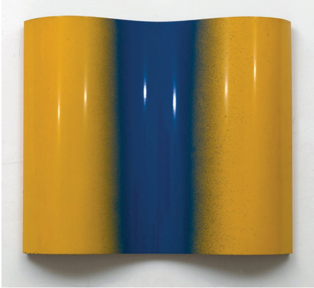
Plastisches Bild (Sculptural Picture), 1966 Courtesy Private Collection | © Photo: Bill Jacobson Studio, New York