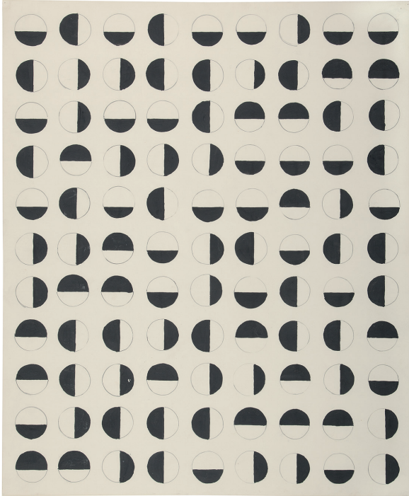
Rasterbild (Grid Picture), 1957