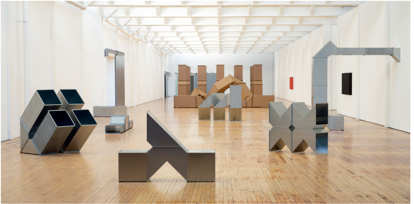
Charlotte Posenenske: Work in Progress, 2019 Installation view, Dia: Beacon, Beacon, New York | Courtesy of the Estate of Charlotte Posenenske, Mehdi Chouakri, Berlin, Peter Freeman, New York, Take Ninagawa, Tokyo and Sofie Van de Velde, Antwerp | © Bill Jacobson Studio, New York, courtesy Dia Art Foundation, New York