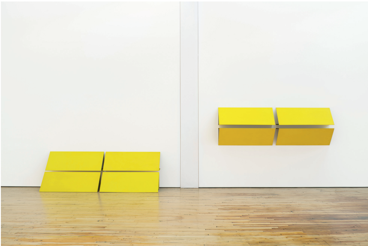
Reliefs Serie C (Reliefs Series C), 1967 Courtesy Daimler Art Collection, Stuttgart/Berlin Charlotte Posenenske: Work in Progress | Installation view Dia: Beacon, Beacon, New York. Estate of Charlotte Posenenske, Frankfurt am Main | © Photo (detail): Bill Jacobson Studio, New York. Courtesy Dia Art Foundation, New York