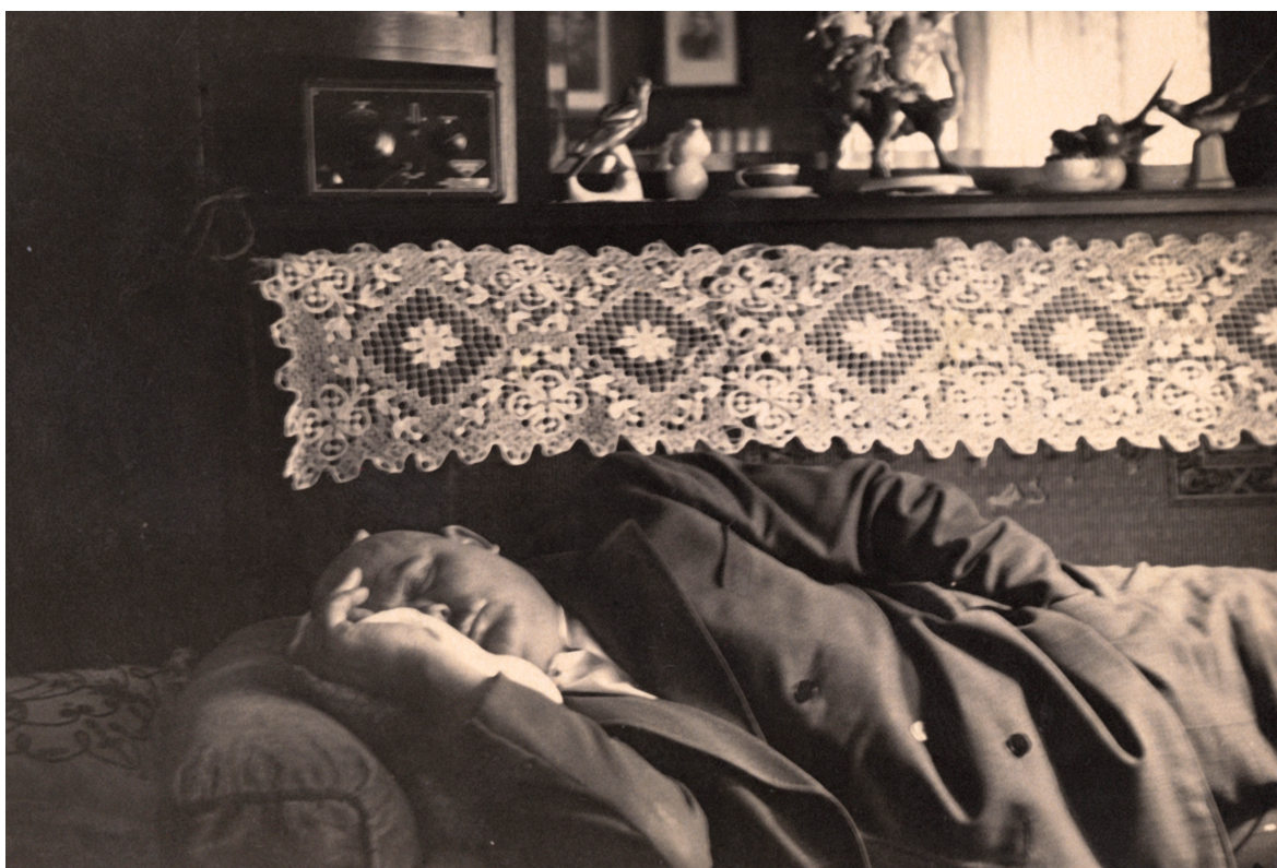
Men Asleep , 2014 Courtesy de l'artiste et Simon Lee Gallery, Londres et Hong Kong © Joao Penalva