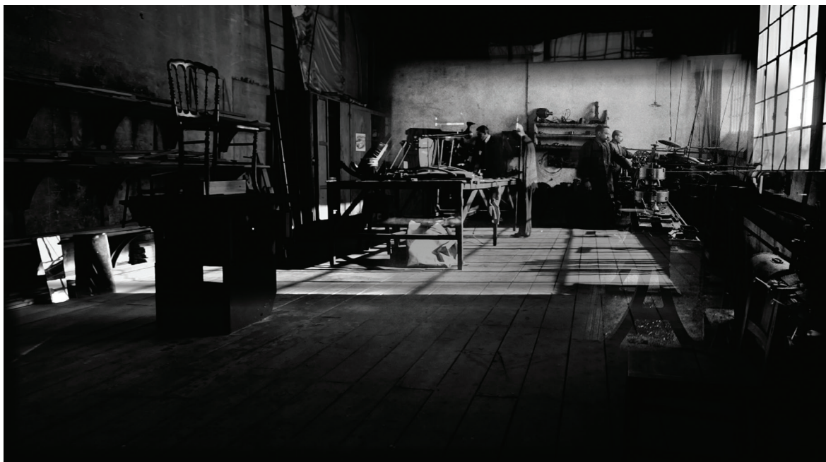
Door , 2018 Production Mudam Luxembourg © João Penalva