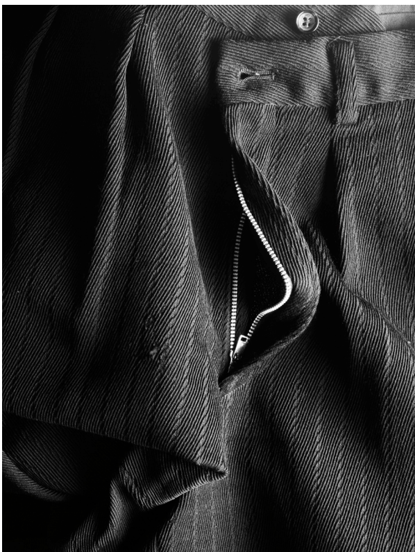
Moth-eaten pair of trousers. Never used, 2010