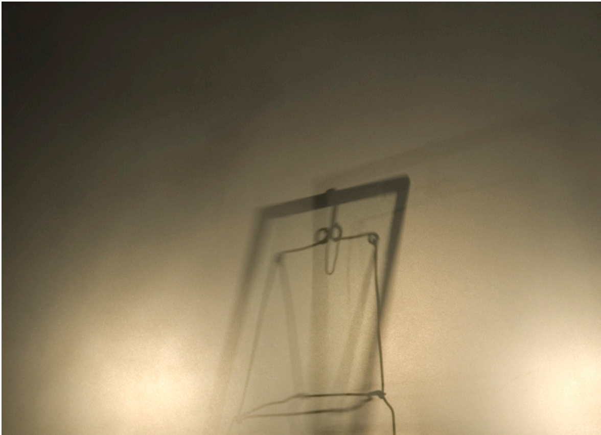
Petit Verre, 2007