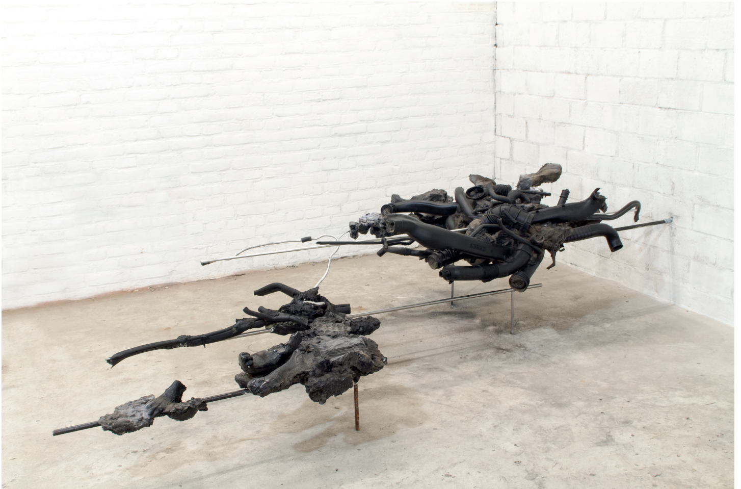
Giulia Cenci, Nightfall , 2019 Collection Mudam Luxembourg – Musée d'Art Moderne Grand-Duc Jean | Donation 2019 - Baloise Group