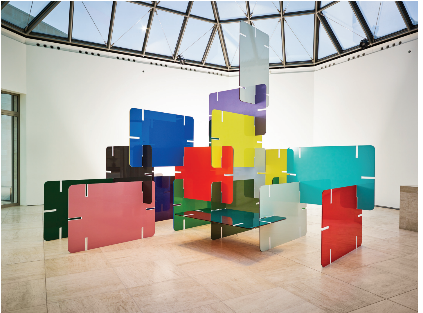
Bruno Peinado , Good Stuff, The Pleasure Principle , 2010

Collection Mudam Luxembourg – Musée d'Art Moderne Grand-Duc Jean | Production Casino Luxembourg – Forum d'art contemporain | Acquisition 2010