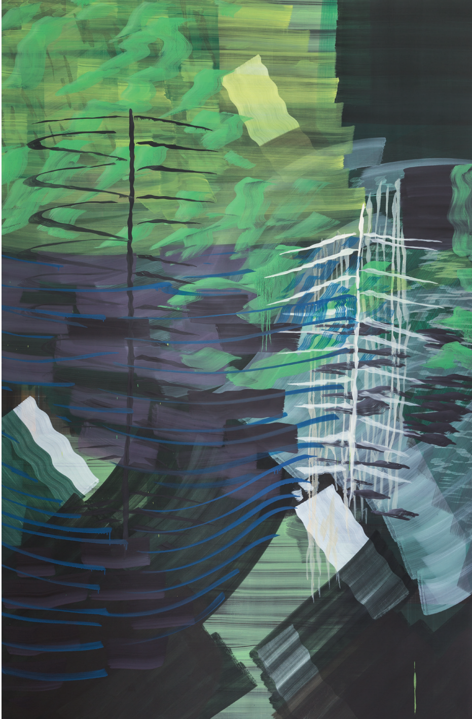
Ana Manso, Expiration , 2018 Collection Mudam Luxembourg – Musée d'Art Moderne Grand-Duc Jean | Acquisition 2018