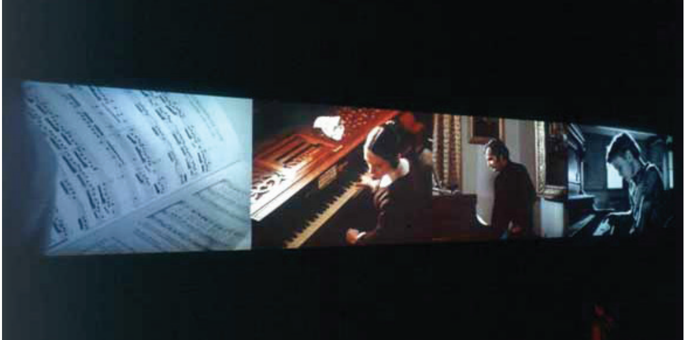
Christian Marclay , Video Quartet , 2002 Collection Mudam Luxembourg – Musée d'Art Moderne Grand-Duc Jean | Commande 2001 - San Francisco Museum of Modern Art et Mudam Luxembourg