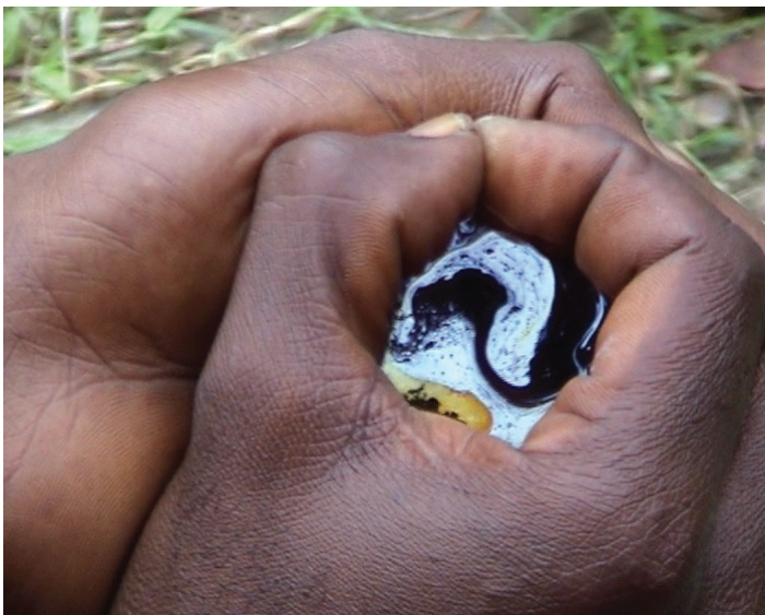
Edith Dekyndt , Provisory Object 03 , 2004 Collection Mudam Luxembourg – Musée d'Art Moderne Grand-Duc Jean Acquisition 2015 © Edith Dekyndt